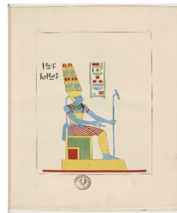
Pantheon égyptien, par Champollion

En lien avec votre projet , visite possible au Musée Champollion de Vif.