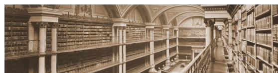
Musée-bibliothèque, place de Verdun

Pagella vous propose de découvrir ses collections, ses images à la loupe, et ses visites guidées dans le patrimoine grenoblois.