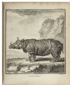
Le rhinocéros de Buffon, tiré de l' Histoire naturelle, générale et particulière, avec la description du cabinet du roi

Comment les naturalistes représentent-ils le monde naturel (animal, végétal, minéral) au fil des siècles ? Voyage dans les Histoires naturelles de Aldrovandi, Buffon, Daubenton, Sainte-Hilaire.