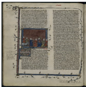
Chroniques de France, jusqu'à l'avènement du roi Jean

Depuis les rouleaux de parchemin du Moyen-Âge jusqu'aux livres d'artistes du 19 e siècle, la bibliothèque possède une grande diversité d'œuvres sur différents supports : peaux de bêtes, papier chiffon, papier industriel de pâte de bois, feuilles de plantes. Les élèves pourront manipuler ces différentes matières et verront plusieurs œuvres sorties des réserves pour l'occasion. Les étapes de la restauration d'un livre leur seront présentées.